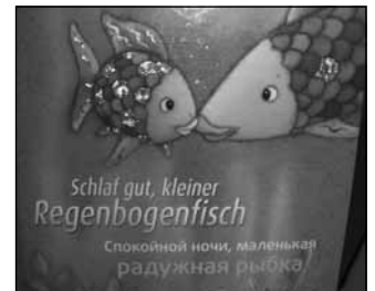
Das von der Stadtbibliothek zur Verfügung gestellte Buch in zwei Sprachen.