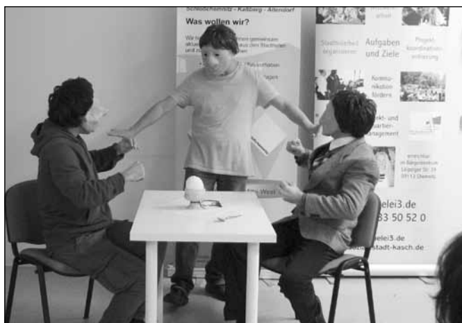
Das ad hoc-Theater erfreute die Besucherinnen und Besucher mit kleinen Sketchen.