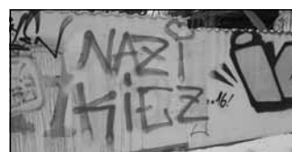
Solche politisch motivierten Sachbeschädigungen bitte melden!

dass Mitglieder der Gruppe ‚Rechtes Plenum‘ vom Sonnenberg hierher gezogen sind und jetzt ihr Revier abstecken wollen. Sie appellieren an die Bevölkerung, aufmerksam nach solchen rechts- oder linksextremistischen Schmierereien in ihrem Umfeld zu schauen und diese oder verdächtige Personen der Polizei zu melden. Auch der Domizil e.V. oder das benachbarte Bürgerzentrum nehmen solche Informationen entgegen, um rechte und linke Gewaltpotenziale frühzeitig zu erkennen und ihnen entgegenwirken zu können.