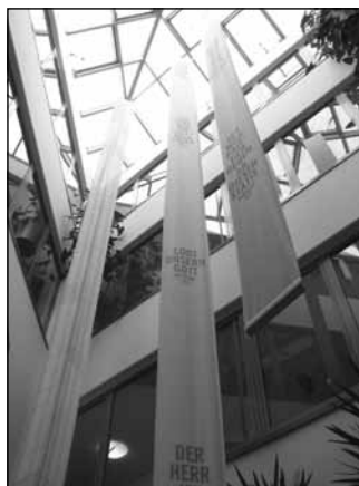
Viel Licht, Grün und Behaglichkeit bieten die Einrichtungen im „Kreuzstift“.

gleichzeitig ihr Zuhause und gewohntes Umfeld nicht aufgeben wollen. Vom Frühstück bis in den Nachmittag hinein bieten wir vielfältige Angebote wie Gedächtnistraining, altersgerechte Gymnastik, Zeitungsschau und Spaziergänge. Es wird in der Gemeinschaft gegessen und es bleibt viel Zeit für persönliche Gespräche.“ Eine Nachfrage nach freien Plätzen lohne sich immer, sagt sie. Zwischen einem und fünf Tagen in der Woche kann der Aufenthalt ganz individuell vereinbart werden. „Auch hier nehmen wir uns viel Zeit für eine individuelle Beratung und zeigen den Gästen und Angehörigen sehr gerne die Räumlichkeiten. Ein Schnuppertag kann vereinbart werden.“